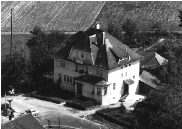
1. Vereinslokal: Bahnhofswirtschaft die 'Neue'